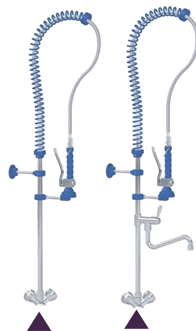
ROBINET STANDARD MO21 444 MO21 445 AVEC COL DE CYGNE