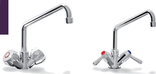
MO21 367 Mélangeur standard