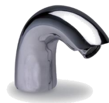
HY46 001 Robinet mitigeur électronique sur secteur ou pile